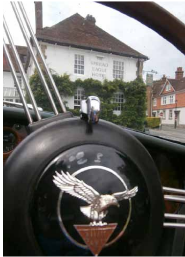
Spread Eagle arriveert bij The Spread Eagle Hotel in Midhurst Some like it British . . .

zee, een koele bries voelt aangenaam. Coen staat te praten met een aantal mannen op de parkeerplaats en we kunnen wel raden waar dat over gaat... heerlijk toch zo'n hobby! 's-Avonds het Gala Dinner in het Redcliffe restaurant. Wij zaten aan een leuke tafel vlak bij een open slaande deur met uitzicht op strand en