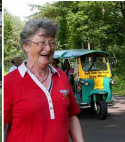
"Eendracht" en onverwachte belangstelling

aangeleverde binnenband ('ik heb altijd reserve binnenbanden bij me'), worden voorzien. Na aankomst in hotel Bakker, en na het bekende uitpakken en