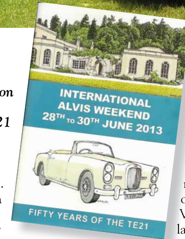
De jubilerende TE 21's op de eerste rij.

Op vrijdagochtend 28 juni vertrekken wij uit Bournemouth en gaan richting