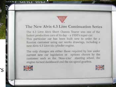
I.A.D. in Killerton House, prachtig weer.